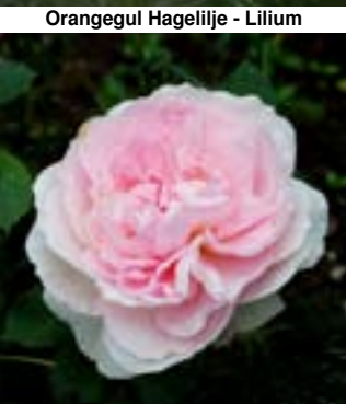
Celestial - Historisk rose