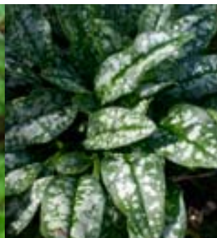
Flekkklungeurt 'Opal' - Pulmonaria