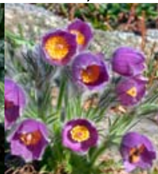
Georgia-Kubjelle - Nye fjellhagestauder