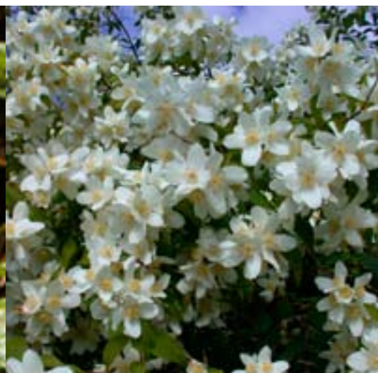
Nordlandskjærsmine 'Waterton' - Prydbusker