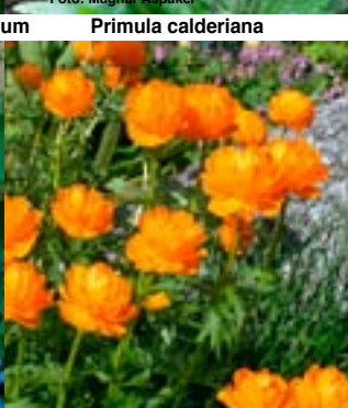
Altai-Ballblom - Trollius