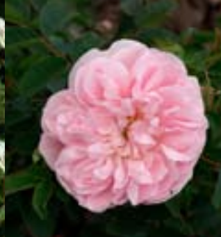
Stanwell Perpetual - Nye roser