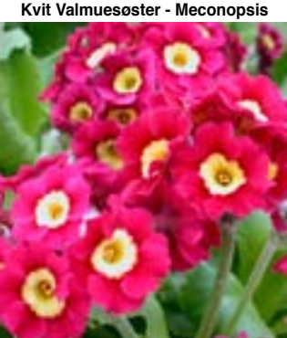
Primulahybrid 2A - Stauder