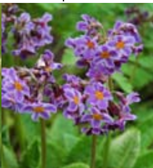
Tannerihybrid - Primula