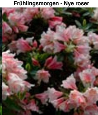
Rhododendron 'Wee Bee'