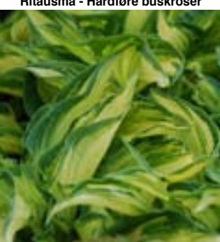
Hosta fortunei 'Albopicta'