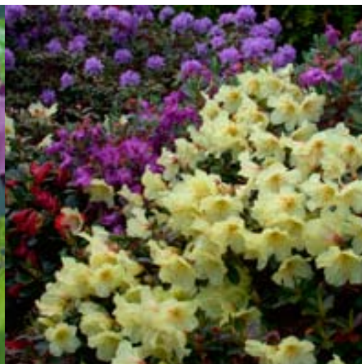
Dvergrhododendron i Thors hage