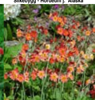
Lysende rosa med øye - Primula