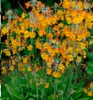
Stor etasjeprimula - Pr. aurantiaca