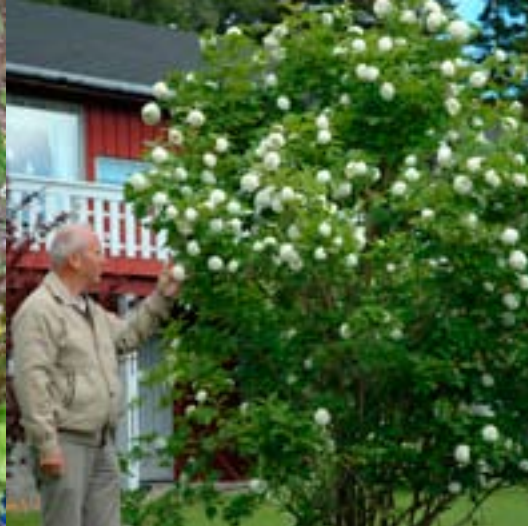
Snøballbusk 'Frøken Norden' - Prydbusker