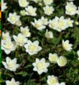
Fylt Kvitveis - Anemone