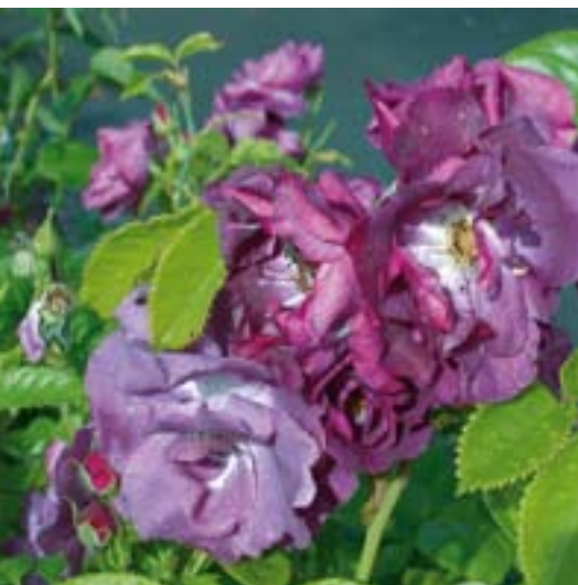
Rapsody in Blue - Nye rosesorter