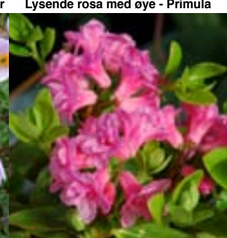
Rho. hirsutum 'Flore Plena'