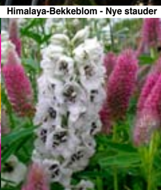
Kvit Ridderspore og Rødkløver - Trifolium