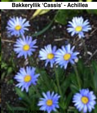
Felicia - Stauder