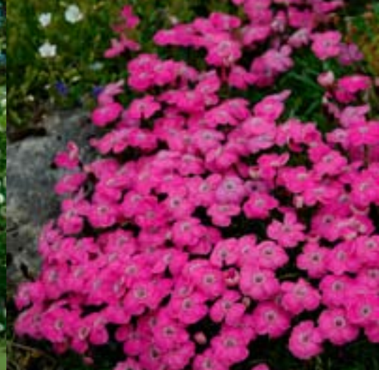
Rosa Alpenellik - Stauder