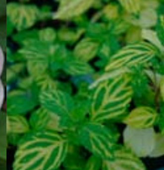
Gullmynte 'Aurea' - Nye stauder