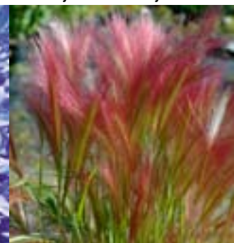
Silkebygg - Hordeum j. 'Alaska'