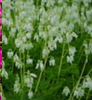
Kvitt Fenrikherte - Dicentra