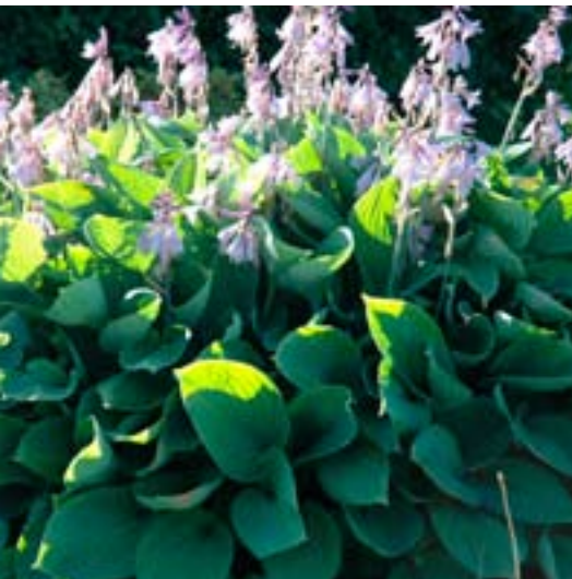
Breibladlilje - Snitt- og Rabattstauder