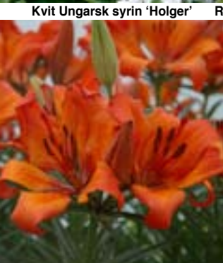
Orangegul Hagelilje - Lilium