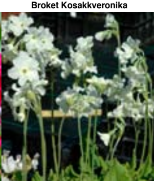
Kvit Tibetprimula - Stauder