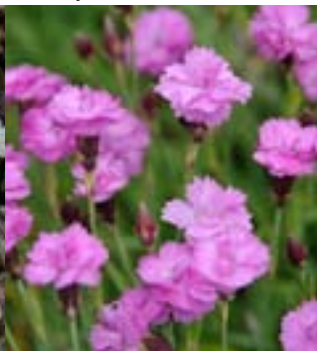
Dobbel Nellikhybrid 'Tiny Rubies'