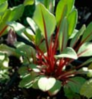
Sølvprimula - Primula