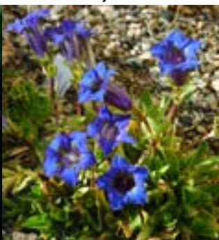
Balkansøte - Stauder