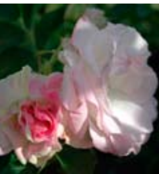
Ritausma - Hardføre buskroser