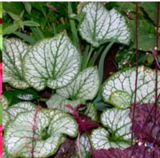
Forglemmeisøster 'Jack Frost' - Stauder