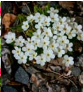
Mathilde-Smånøkkel - Nye stauder