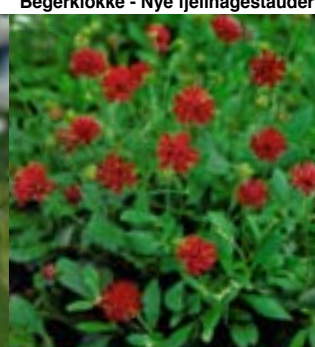
Makedonia-Rødknapp - Nye stauder