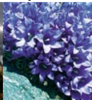
Begerklokke - Nye fjellhagestauder