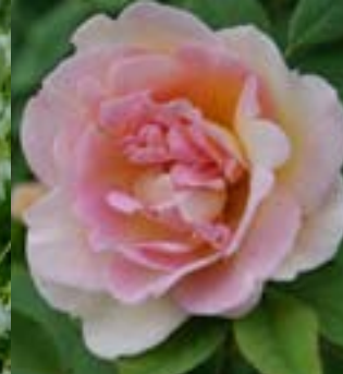
Frühlingsduft - Historiske roser