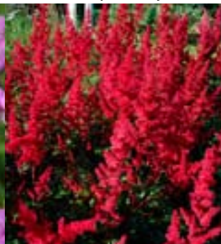
Astilbe 'Fanal' - Astilbe