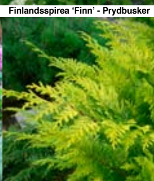
Gullsyppres 'Kelleris Gold'