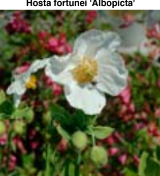
Kvit Valmuesøster - Meconopsis