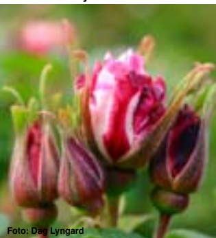
Louise Bugnet - Kanadisk buskrose