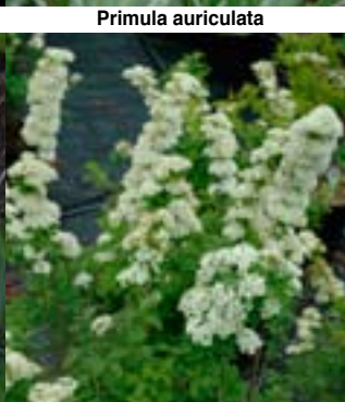
Finlandsspirea 'Finn' - Prydbusker