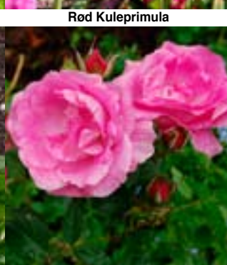
Prairie Joy - Nye Kanadiske roser