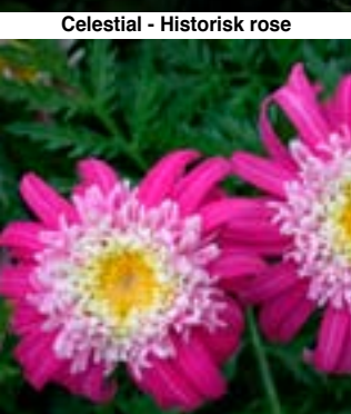
Låg fylt Rosenkrage 'Red Dwarf'