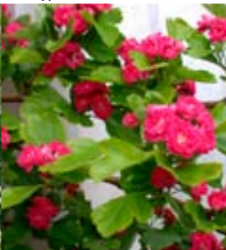
Rosehagtorn 'Paul Scarlet' - Nye busker