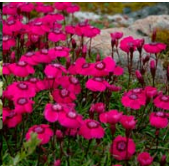
Alpenellik 'Joans Blood' - Stauder