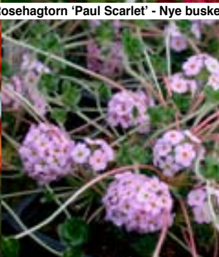
Krypsmånøkkel - Androsace