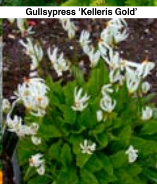
Kvit Gudeblom - Dodecatheon