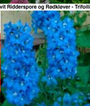
Ridderspore 'Summer Skies' - Delphinium