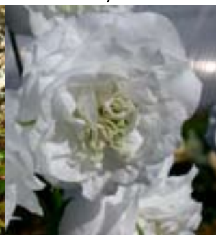
Fylt Fagerklokke 'Snøvit'