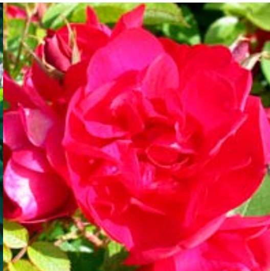
Hansaland - Hardføre buskroser