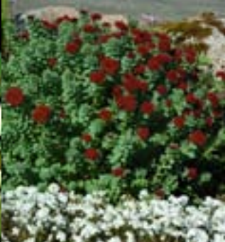
Dyprød rosenrot - Rhodiola