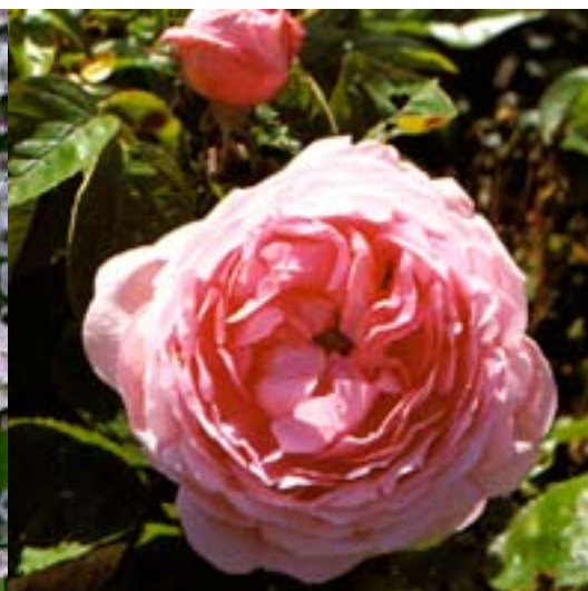
Constance Spray - Nye rosesorter