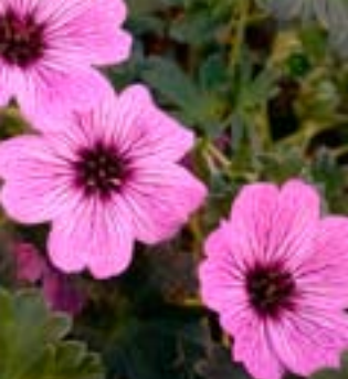
Balkanstorkenebb 'Ballerina' - Granium