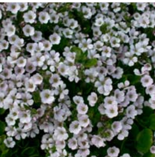
Krypslør - Gypsophila cerastioides