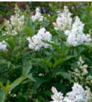
Kvit Ungarsk syrin 'Holger'