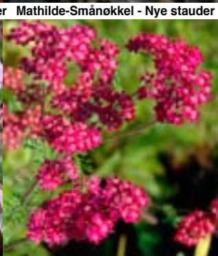
Bakkeryllik 'Cassis' - Achillea